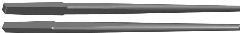
Reconstitution 3D (logiciel PovRay 3)